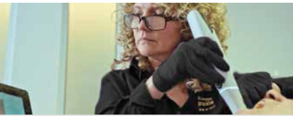
Abdruckfreie Praxis (Digital mit Scanner)